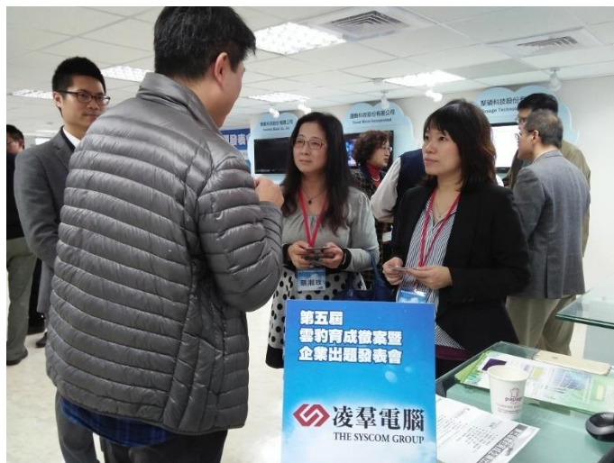
圖、主題說明會企業導師-研華科技(左)與凌羣電腦(右)與新創團隊交流熱烈

除了 3 月 14 日舉辦台北場的說明會外，本次雲豹育成執行團隊更在中南部舉辦三場說明會。第五屆雲豹計畫將會於 4 月 21 日截止報名，之後將會對申請團隊做初選以及複選的審查，預期將會協助企業導師媒合適合、且能為大企業發展有益處之新創企業。今年除了雲豹育成計畫之外，也特別針對雲豹育成企業導師安排『企業專場』的新創對接，加碼協助企業會員創新。