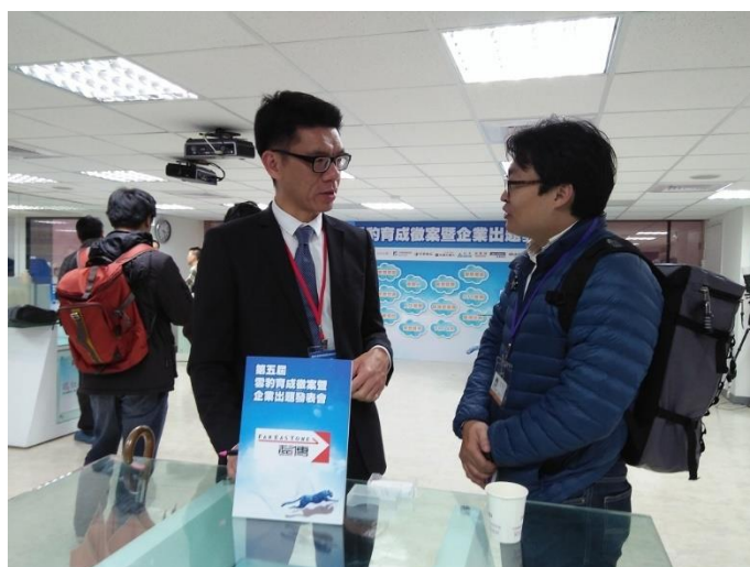
圖、主題說明會企業導師-英業達(左)與遠傳電信(右)與新創團隊交流熱烈