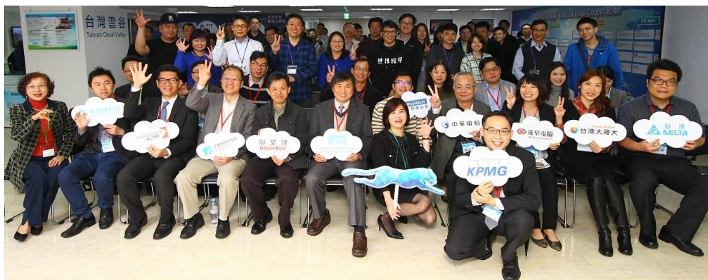
圖、台北場說明會吸引超過 150 位來賓參與

活動當天有超過 150 位來賓蒞臨指導，包括合作夥伴如 KPMG、台灣微軟、邁特電子、若水資本、創夢市集、臺北科技大學育成中心、台灣科技大學育成中心、明志科技大學、中華大學以及其他新創夥伴們。