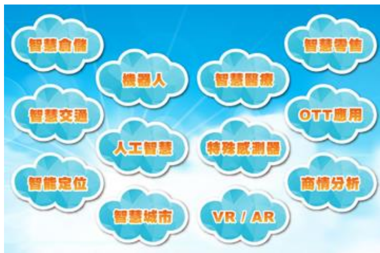
圖、第五屆雲豹育成企業出題主軸

今年雲豹育成企業導師有工研院、中華電信、台灣大哥大、台達電、英業達、研華科技、凌群電腦、遠傳電信、愛爾達科技等，出題的方向圍繞在物聯網、大數據、雲端應用等，證明雲端物聯網創新應用的市場潛力無窮。