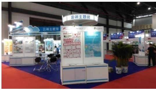
昆博會雲端主題館