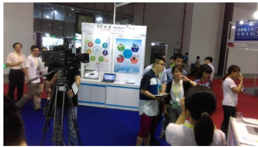
昆山電視台採訪英業達