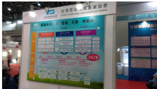
台灣雲端協會參展