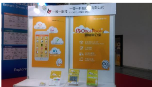
一等等一科技參展