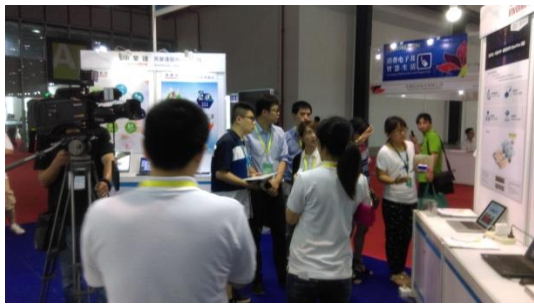
昆山電視台採訪英業達