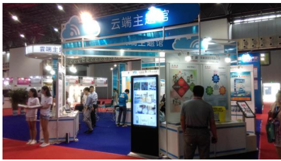
昆博會雲端主題館