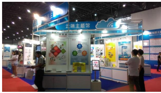
昆博會雲端主題館